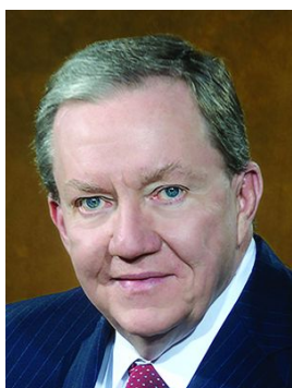
Джеймс ШЕННОН, Президент ИЕС