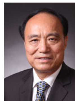
Хоулинь ЧЖАО, Генеральный секретарь ИТУ

Так же как стандарты играли ключевую роль во время первой промышленной революции 250 лет назад, они будут играть важнейшую роль и в четвертой.